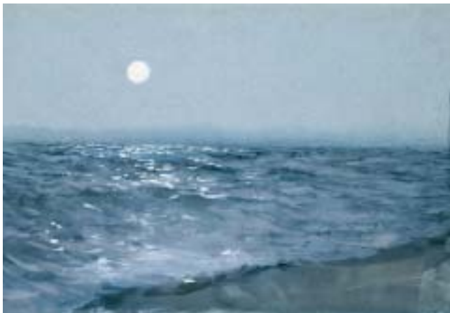
Havet i månensken St Ives, 1888 Zornsamlingsarna Mora

Under en vistelse i konstnärskolonin St. Ives i England började Zorn hösten 1887 arbeta mer medvetet med oljemåleriet. Ett