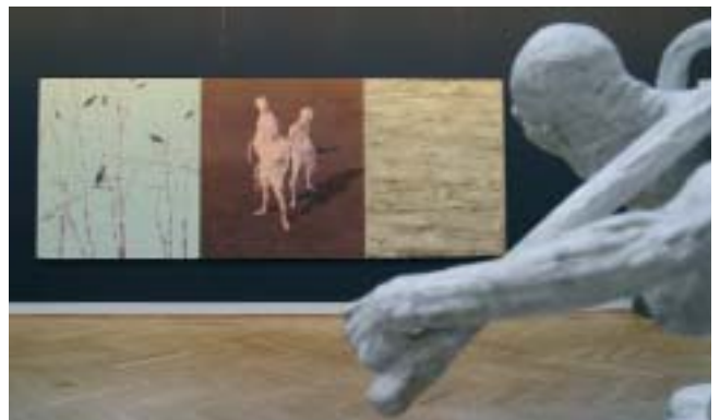
Michael Kvium gick i clinch med nordisk symbolism.