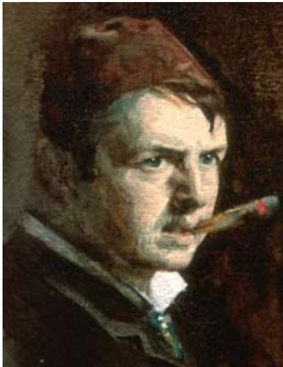
Självporträtt, 1882 Nationalmuseum Stockholm

Att han ändå främst kom att arbeta med akvarell hade antagligen både med lust och nödvändighet att göra. Akvarell-