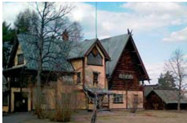
Zorngården i Mora