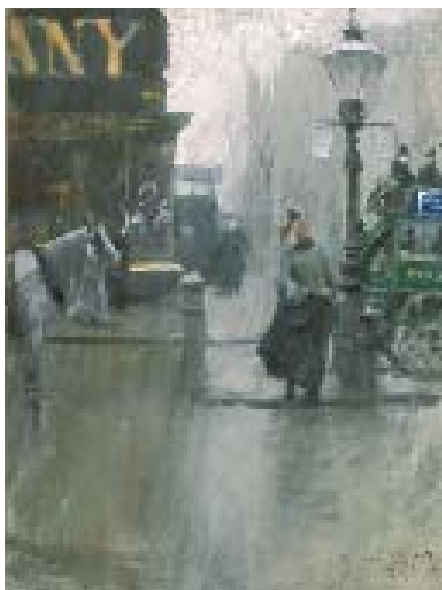
Impressions de Londres, 1890 Göteborgs Konstmuseum

Han arbetade med många förstudier och fotografier för att komponera sin bild som en hyllning till arbetet med jorden och de människor som han vuxit upp med. Trots alla förstudier fångar målningen en känsla av vardag och solljus samtidigt som den är genomarbetad och så detaljerad att den av vissa kritiserades för att vara överarbetad.